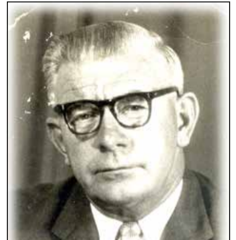
LD Gerharts tabata hopi yegá na AFBW den kuminsamentu. AFBW a sostené tambe POB i PPBU den elekshon di Staten na sèptèmber 1969.

Por a sinti ku na Boneiru AFBW tabata lèn mas na banda di Partido